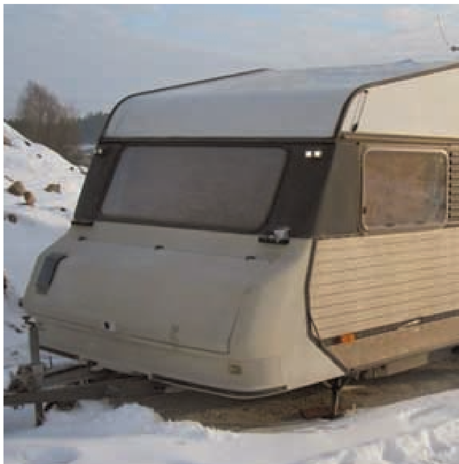
Det nya boendet för dem som måste sälja sin villa?

En villaägare har två lyckliga dagar i sitt liv – den dagen han flyttar in och den dagen han flyttar ut.