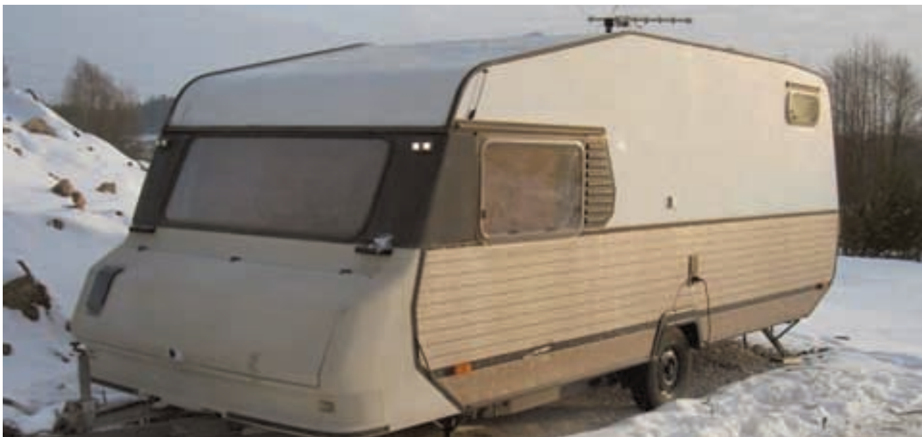
Det nya boendet för dem som måste sälja sin villa?

Det sägs att bostadsbeskattningen inte bör brytas ut ur kapitalbeskattningen. Det kan jag generellt hålla med om, men de småhusfastigheter som fungerar som permanentbostäder följer inte de kriterier som gäller som grund för kapitalbeskattning, eftersom kapitalbeskattningen bygger på följande tre steg: